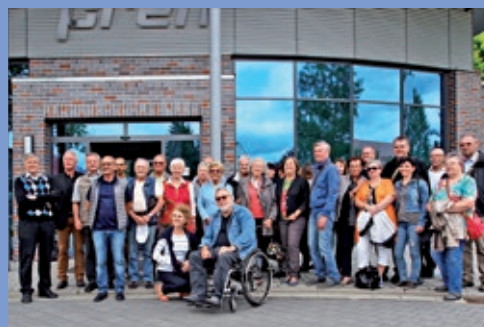
Besuch aus Oberpullendorf