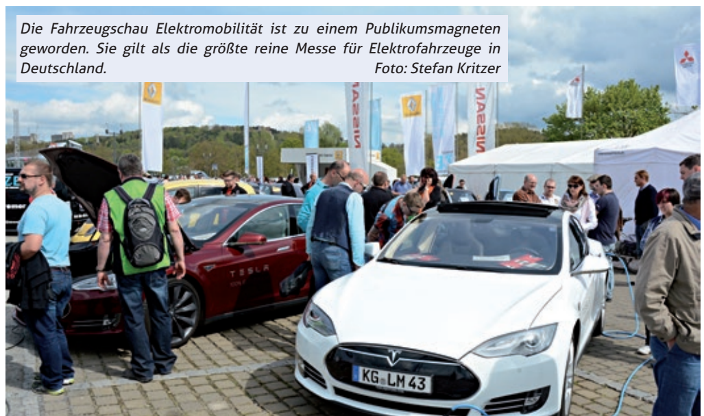
Die Fahrzeugschau Elektromobilität ist zu einem Publikumsmagneten geworden. Sie gilt als die größte reine Messe für Elektrofahrzeuge in Deutschland.

Die gegenwärtige Diskussion um eine Kaufprämie für Elektroautos lässt die Macher der Modellstadt natür-