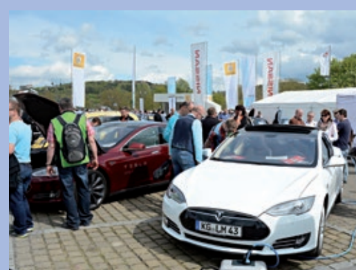
Die Zukunft liegt in der Stadt