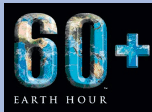
Earth Hour 2016