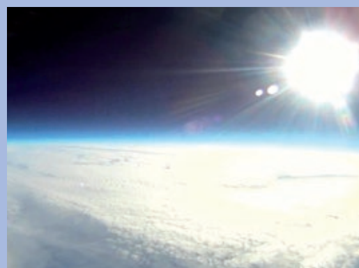
KinderUni: Projekt Skywalker