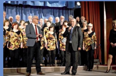
15 Jahre Freundschaft zwischen Bilovec und Bad Neustadt