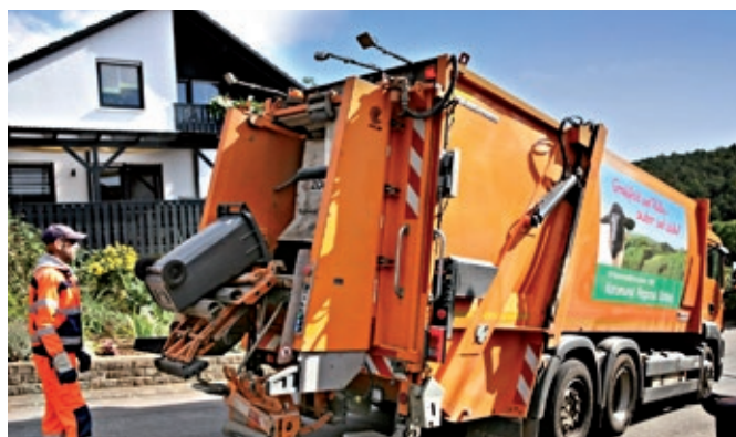
Was passiert mit unserem Hausmüll? Das Wertstoffzentrum in Bad Neustadt-Brendlorenzen lädt am 07. Mai von 10 bis 16 Uhr zum Tag der offenen Tür ein.