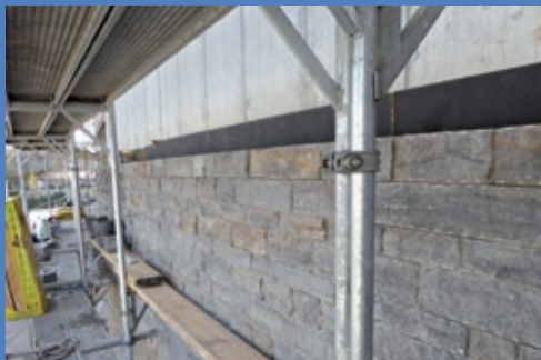
Neubau Stadthalle Baustandsbericht