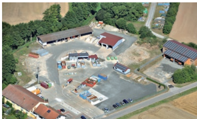
Der Landkreis Rhön-Grabfeld lädt am 7. Mai 2016 zum Tag der offenen Tür in das Wertstoffzentrum Brendlorenzen ein. Besucher erleben anschaulich das umfassende Entsorgungsspektrum für die rund 27.000 Haushalte in der Region.

Eine besondere Attraktion bildet die Fahrzeugschau des modernen Fuhrparks. Ausstellungen und Vorführungen rund um die richtige Entsorgung und umweltfreundliche Verwertung ergänzen das umfangreiche Programm für die ganze Familie. Für das leibliche Wohl ist ebenso gesorgt wie für die musikalische Umrah-