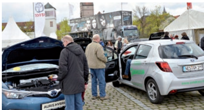
Die 6. Fahrzeugschau Elektromobilität in Bad Neustadt zog zahlreiche Interessenten aus ganz Deutschland an.

Weitere Informationen unter www.m-e-nes.de und auf Facebook.