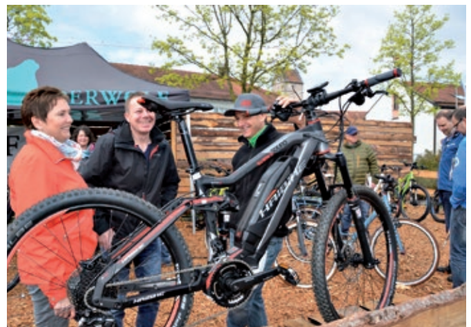
E-Bikes sind der Motor der Elektromobilität. Dies zeigte sich erneut bei der 6. Fahrzeugschau Elektromobilität, wo die Fahrradhändler Hunderte von Modellen anboten.