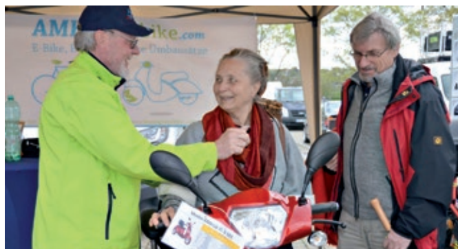
Fasziniert ließen sich die Besucher der 6. Fahrzeugschau Elektromobilität die zahlreichen Modelle mit E-Antrieb vorstellen.