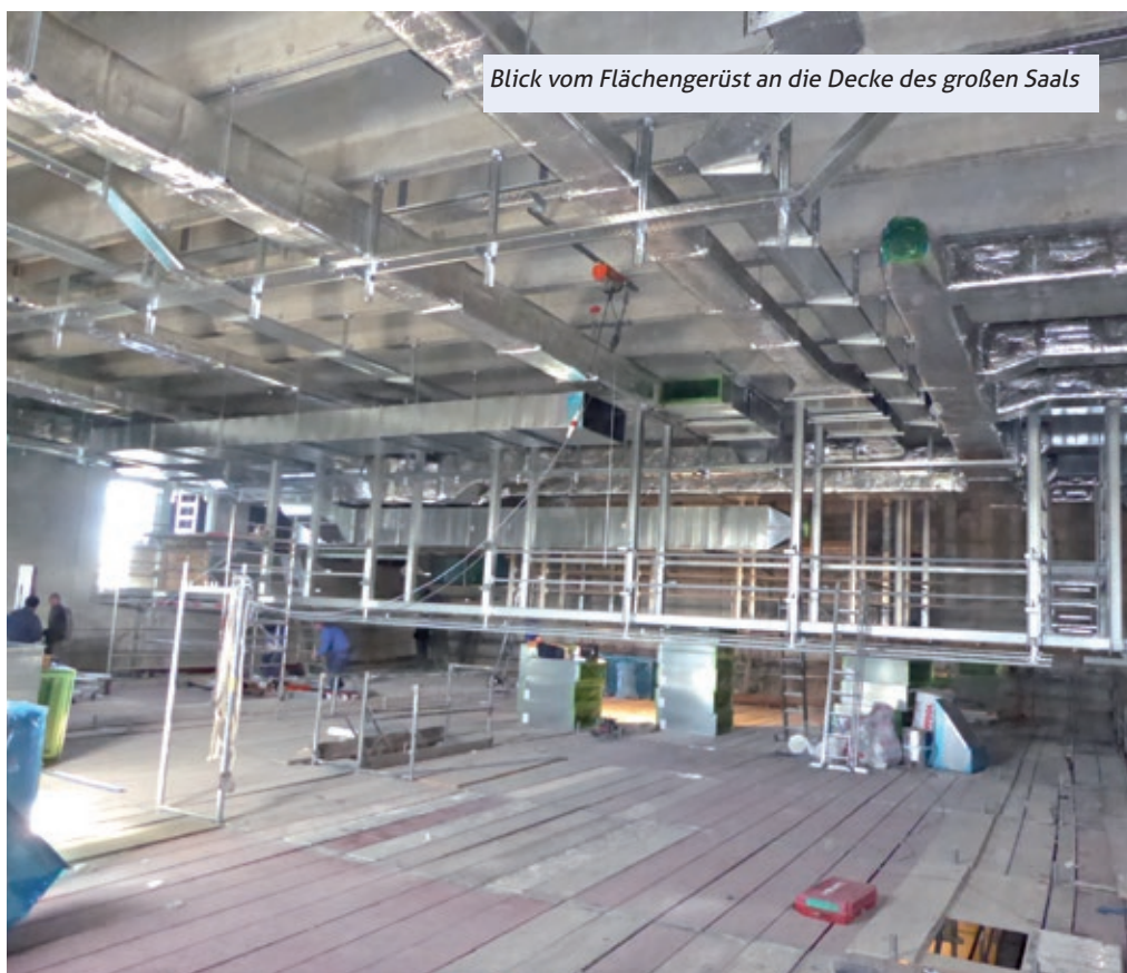
Blick vom Flächengerüst an die Decke des großen Saals

Parallel zu den Arbeiten an den Fassaden laufen die Arbeiten für den Innenausbau.