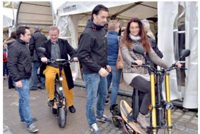
Trendige E-Fahrzeuge auf zwei Rädern gab es in allen Facetten auf der 6. Fahrzeugschau Elektromobilität zu bewundern.

zeige sehr anschaulich den enormen technischen Fortschritt, den die Elektromobilität derzeit nimmt. Bestes Beispiel hierfür sei die neue Schnell-Ladestation, die im Rahmen der Veranstaltung eingeweiht wurde. Erfreut zeigte sich das Stadtoberhaupt darüber, dass sich die VR-Bank Rhön-Grabfeld und die Sparkasse bei der Förderung mitengagierten und somit wesentlich zu dieser Neuerung beigetragen haben. Auch hier zeigt Bad Neustadt seine Vorreiterrolle: die neue Technik gibt es bisher nur selten in Deutschland. Viel Optimismus verbreiteten die politischen Vertreter bei der Eröffnung der Veranstaltung. Sie sagten der Elektromobilität eine sichere Zukunft voraus und versprachen Bad Neustadt ihre volle Unterstützung bei den weiteren Aktivitäten. Respekt zollten auch die Gäste aus den anderen Modellregionen für Elektromobilität Bad Neustadt. „Mich beeindruckt das Herzblut, mit dem die Rhöner Elektromobilität leben“, sagte Katrin Juds vom E-Wald (Bayerischer Wald) begeistert. Besonders gut findet sie, dass bei der Fahrzeugschau