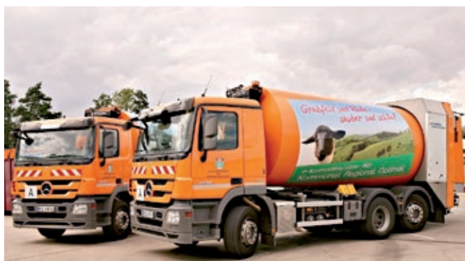
Wer selbst einmal hinter dem Steuer eines Entsorgungsfahrzeugs sitzen möchte, sollte am 07. Mai beim Tag der offenen Tür im Wertstoffzentrum Bad Neustadt-Brendlorenzen vorbeischaun.

Ebenso gibt es ein Preisausschreiben mit attraktiven Gewinnen. www.abfallinfo-rhoen-grabfeld.de