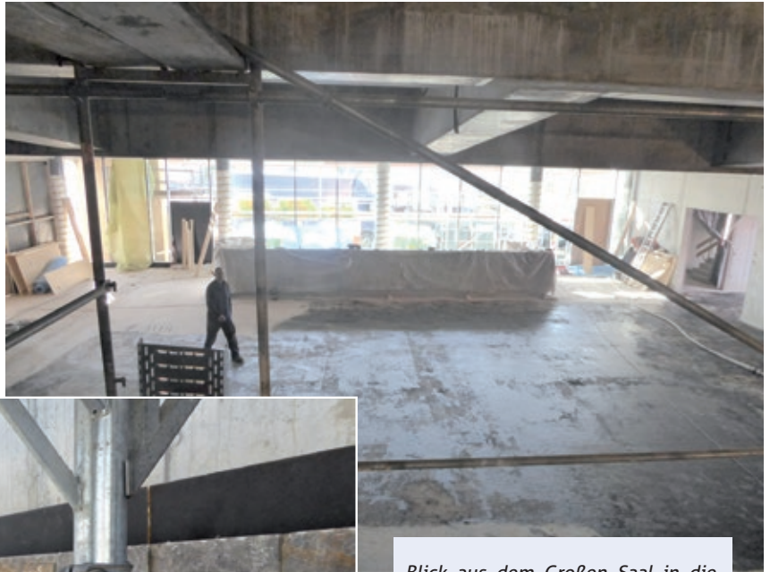
Blick aus dem Großen Saal in die Saalerweiterung mit Bar in Bildmitte

Mit dem Bau der großen Bar in der Saalerweiterung an der Glasfassade zur Straße „An der Stadthalle“ wurde ebenfalls bereits begonnen. Die Konturen sind schon erkennbar.