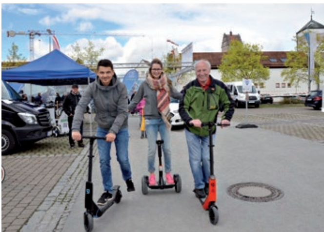
Testfahrten für alle Generationen boten die Aussteller der 6. Fahrzeugschau Elektromobilität den zahlreichen Gästen an.