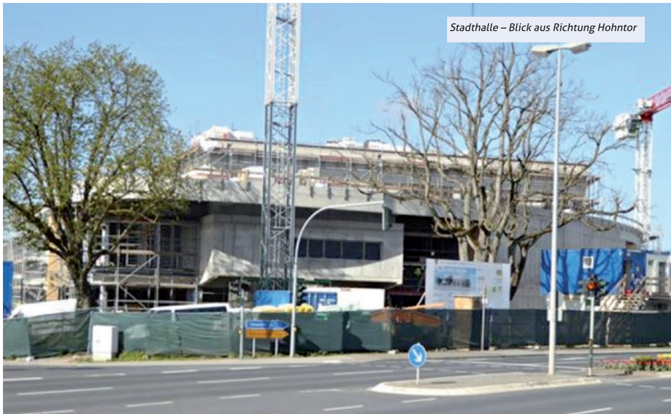
Stadthalle – Blick aus Richtung Hohntor

Nachdem sich die Bevölkerung zum Richtfest am 05.04.2016 erstmals ein Bild vom Inneren der neuen Stadthalle machen konnte, möchten wir Sie von dieser Ausgabe des Stadtmagazins an mit einer monatlichen Fotodokumentation über den Fortschritt der Bauarbeiten informieren.