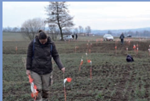
KinderUni Bad Neustadt: Ein Hafen an der Saale?