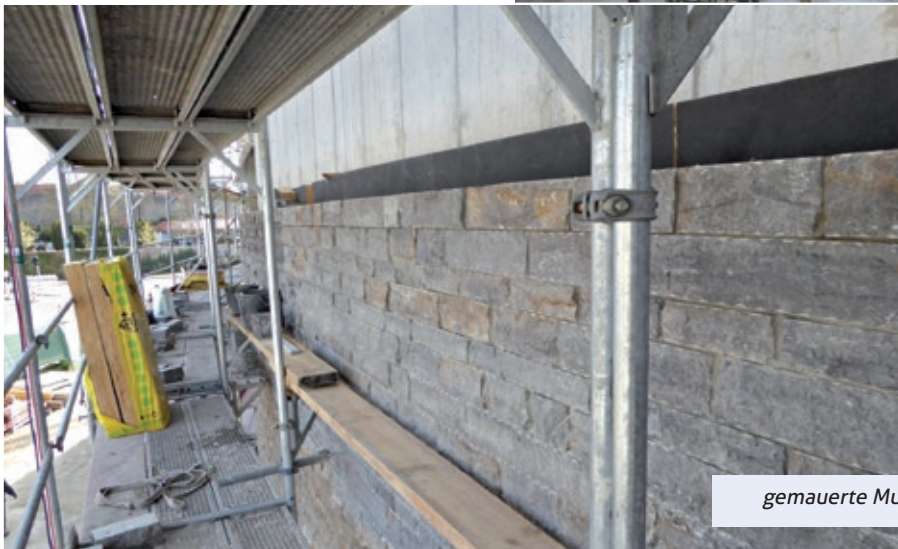
gemauerte Muschelkalkfassade – Detailausschnitt