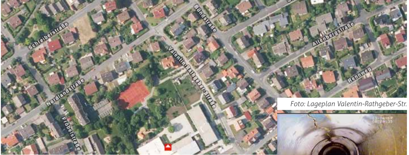
Foto: Lageplan Valentin-Rathgeber-Str.