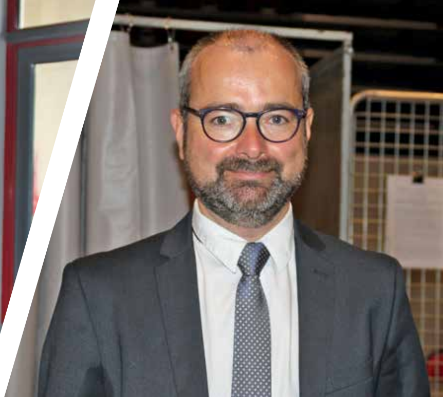
Hervé Maunoury, neuer Bürgermeister von Falaise