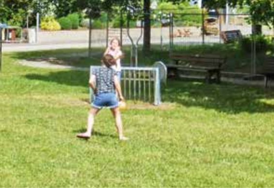
Fotos: Spielplatz in der Liebenthaler Straße in Herschfeld