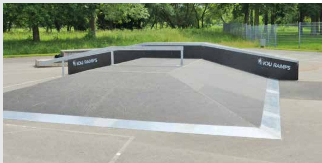
Fotos: Neues Element auf dem Skater-Park