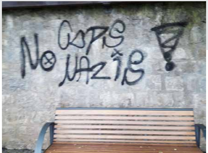
An der Stadtmauer