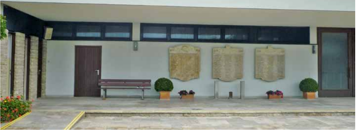
Foto: Aktueller Standort der Gedenktafeln