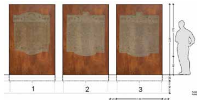
Foto: Skizze der Gedenktafeln

Der neue Standort befindet sich an der Friedhofsmauer zur Goethestraße.