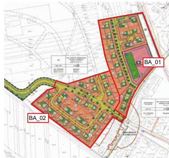
Auszug Bebauungsplan