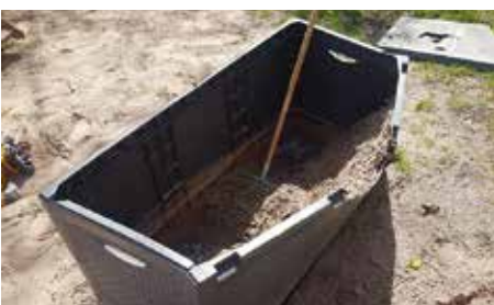
Beispiele auf städtischen Spielplätzen.

Vielen Dank für Ihr Verständnis und Ihre Rücksichtnahme.