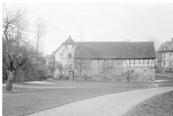
Die Glübersmühle mit Brücke über den Mühlgraben 1920.

Wo: Bad Neustadt am Busbahnhof, unterhalb der Falaiser Brücke