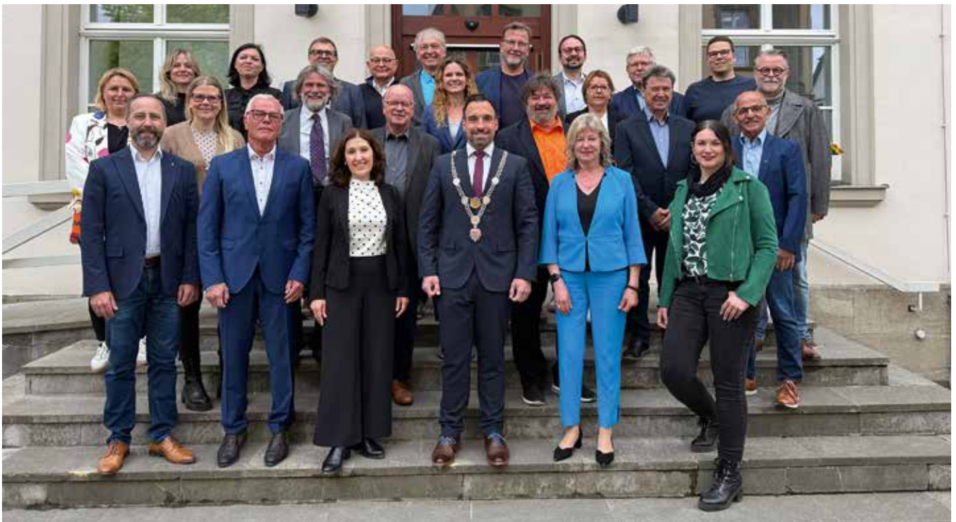
Die Mitglieder des Stadtrates 2026 bis 2032 vor der konstituierenden Sitzung.