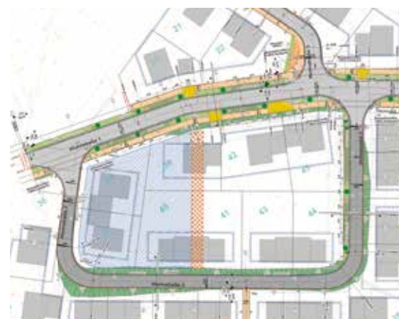
Auszug Ausführungsplanung