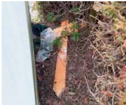
Beispiel auf städtischen Friedhöfen

Die Stadt Bad Neustadt a. d. Saale bittet die Angehörigen um Verständnis, wenn diese Gegenstände vom städtischen Bauhof entfernt und dort zur Abholung bereitgestellt werden.