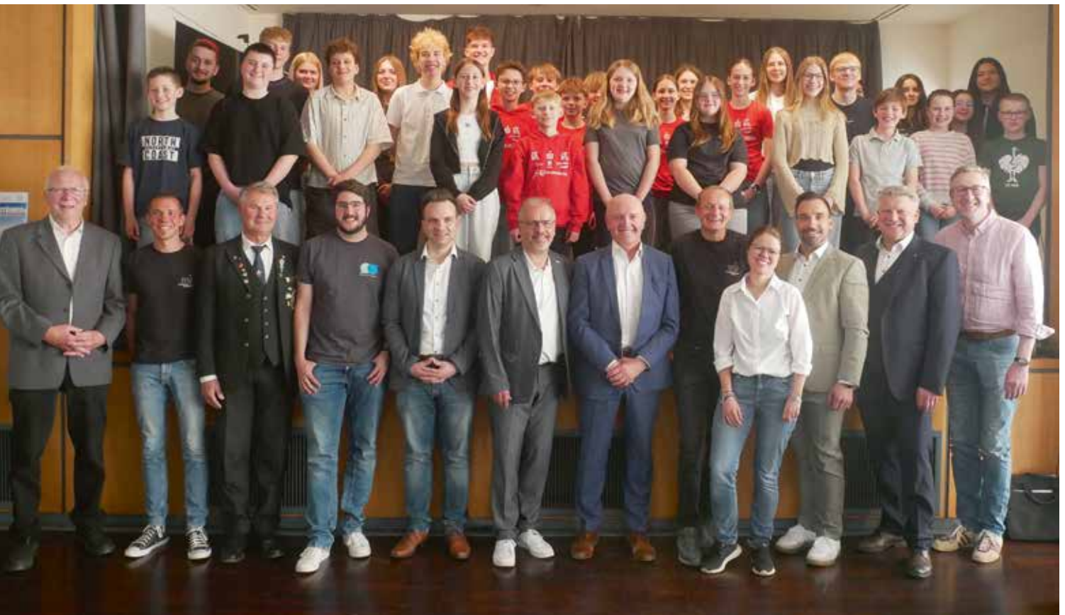
Die erfolgreichen Sportlerinnen und Sportler.