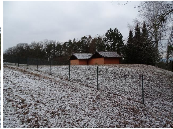
Abb. 4: Hochbehälter nördl. geplanter Bebauung

Ein Teilbereich des nördlich an das Untersuchungsgebiet angrenzenden Waldes unterliegt ebenfalls dem Schutz des § 39 BNatSchG i. V. m. Art. 16 BayNatSchG (Biotop 5627-1128-002).