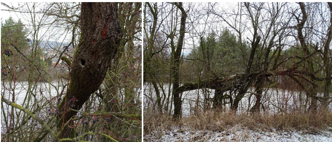
Abb. 2: Hecke mit Totholz und Höhlenbäumen nördl. Von-Guttenberg- Str.

Das Plangebiet schließt südlich an die bestehende Wohnbebauung und somit den Ortsrand von Bad Neustadt a.d. Saale an. Das Gelände fällt nach Norden zum Ortsrand hin ab.