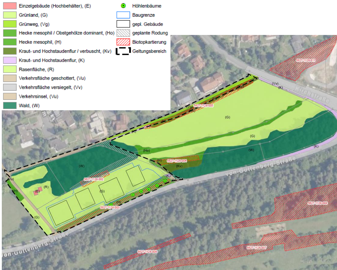
Abb. 5: Bestandsplan zur Grünordnung mit geplantem Eingriff

Im Untersuchungsraum kommen folgende Biotopflächen vor, bzw. grenzen unmittelbar an diesen an: