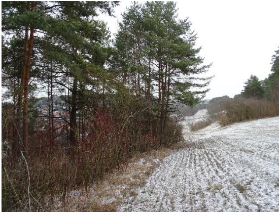
Abb. 3: Wald nördl. geplanter Bebauung

Die Hecke entlang der von-Gutenberg-Straße im Süden des Untersuchungsgebietes weist zum Teil alte Gehölze mit Höhlenstrukturen sowie Tot- und Bruchholz auf. Sie unterliegt dem Schutz nach § 39 BNatSchG i. V. m. Art. 16 BayNatSchG (Biotop 5627-1128-003).