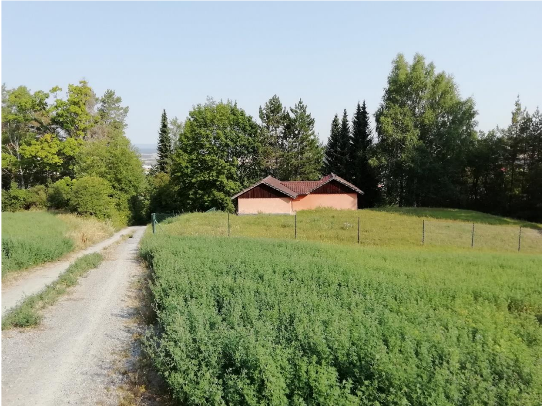
Abb. 1: Hochbehälter und landwirtschaftlich genutzte Fläche

der östlich davon liegende Wald an. Den Großteil des Untersuchungsgebietes stellt eine artenarme Landwirtschaftsfläche dar, welche weiter nach Osten hin verläuft. Die Fläche stellte zum Zeitpunkt der Begehung im August in seinem Bestand hauptsächlich Luzerne dar und wird daher in ihrer Funktion (geschlossene Vegetationsdecke) als Grünland eingeschätzt.