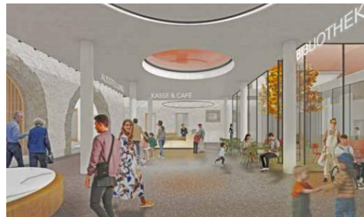
Visualisierung des Foyers (Architekten BuruckerBarnikol 2022)