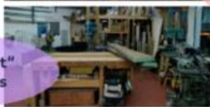
„Dritter Ort“ Kulturhaus